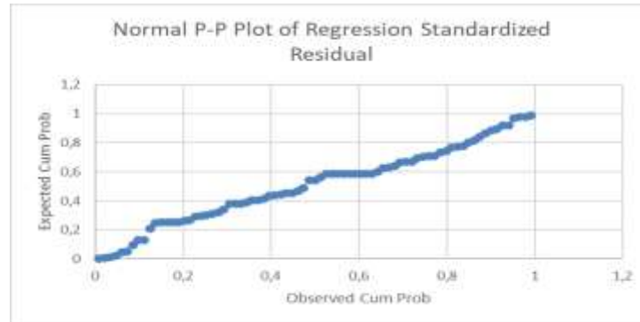
Gambar 1. Hasil Output Normalitas

mendapatkan apakah data berdistribusi normal yaitu dengan melakukan pemeriksaan terhadap plot grafik normal. Jika data terdistribusi normal maka grafik akan menyebar secara diagonal. Berikut hasil uji normalitas: