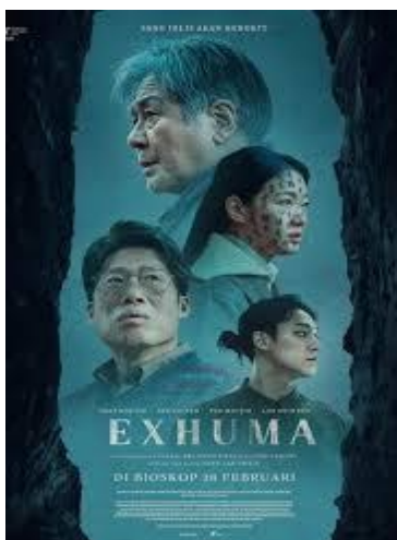
Gambar 2. Poster Film Exhuma

Film “Exhuma” merupakan karya sutradara Jae-hyun Jang. Secara umum, Exhuma atau Pamyu menceritakan tentang pemindahan kuburan misterius dengan imbalan yang besar. Pemindahan ini dilakukan oleh dua pengusir setan yakni Harim yang diperankan oleh Kim Go-eun dan Lee Do-hyun sebagai Bong Gil, seorang ahli pemakaman Ko Young Geun (Yoo Hae-jin), dan seorang pakar feng shui Kim Sang Deok (Choi Min-sik).