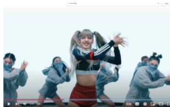
Gambar 1. Unsur Uang

Gambar 1, direpresentasikan dengan unsur uang yang diambil pada detik ke 59 dengan sign berupa visualisasi tarian dan teks “Dollar, dollars dropping on my ass tonight” memiliki objek visualisasi tarian Lisa menggerakkan kedua telapak tangan berlawanan yang mengandung unsur uang. yang selanjutnya diinterpretasikan sebagai bentuk penghamburan uang dengan visualisasi tarian mengapit kedua tangan dan menggerakannya berlawanan.