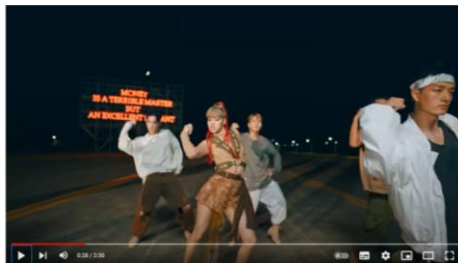
Gambar 6 Kerja Keras

Representasi makna yang keenam ditunjukan melalui teks Bitch, I do the money dance, I just made a hundred bands dengan visualisasi gerakan tarian sbb: