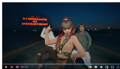
Gambar 7. Kebahagiaan

Terakhir, representasi materialism dijelaskan melalui makna kebahagiaan. Sign dilakukan melalui teks Bitch, I do the money dance, I just made a hundred bands dan visualisasi gambar sbb: